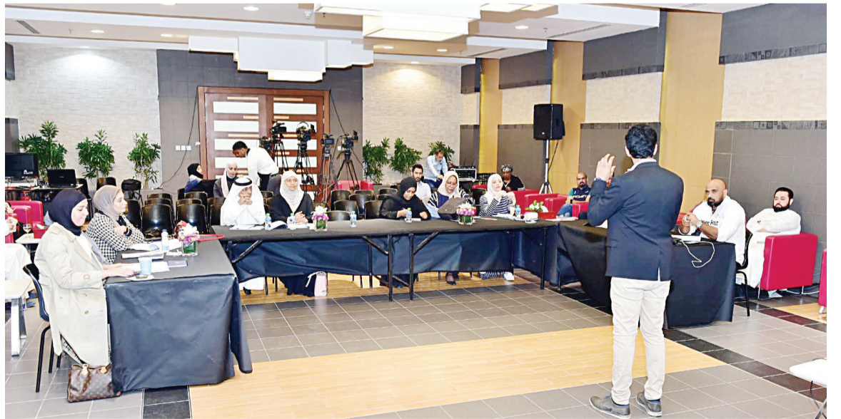
المشاركون في الورشة

ليس بالضرورة أن يكون صوت المعلق رخيماً أجش خشناً فالأهم إتقان مهارات الأداء